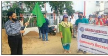
हरी झंडी दिखाते प्राचार्य।