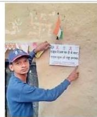
पोस्टर चिपकते स्वयंसेवक।