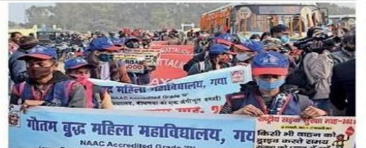
ट्रैफिक नियमों के पालन को शपथ लेते लोग।