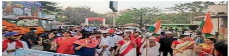
झांकी में शामिल विद्यार्थी व शिक्षक।