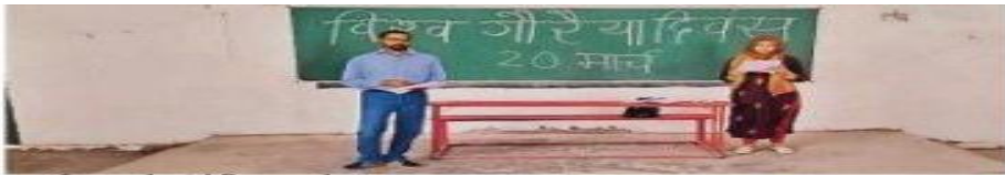
कार्यक्रम को संबोधित करते प्राध्यापक .