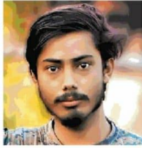
सचिन कुमार • जागरण

जागरण संवाददाता, गया : अनुग्रह मेमोरियल कॉलेज के राष्ट्रीय सेवा योजना इकाई की ओर से विजिलेंस जागरूकता सप्ताह के अंतर्गत राष्ट्रीय एकता दिवस पर सतर्क भारत, समृद्ध भारत विषय पर पोस्टर एवं स्लोगन राइटिंग ऑनलाइन प्रतियोगिता का आयोजन किया गया था। जिसकी अंतिम तिथि 2 नवंबर तक थी।