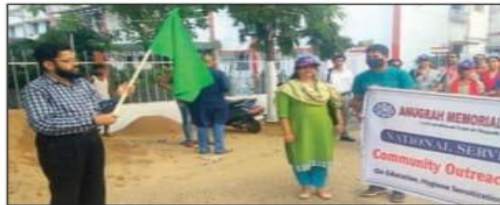
हरी झंडी दिखाते प्राचार्य।