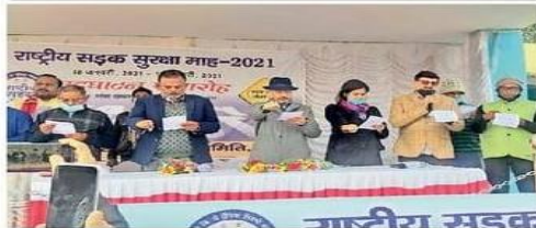
ट्रैफिक नियमों के पालन को शपथ लेते लोग।