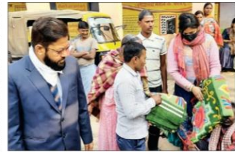
गर्म कपड़े का वितरण करते छात्रों।