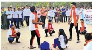
नाटक के माध्यम से जागरूक करते स्टूडेंट्स.

नुक्कड़ नाटक की प्रस्तुति : गांधी मैदान स्थित गांधी मंडप में सभी ने दो मिनट का मौन रख कर आजादी के सभी वीर सपूतों को श्रद्धांजलि दी। श्रद्धांजलि सभा के पश्चात नशा मुक्ति पर आधारित नुक्कड़ नाटक के माध्यम से बिहार सरकार को महत्वकांक्षी योजना नशा मुक्ति विपणन आधारित प्रस्तुतियां दीं। साइकिल रैली में शिक्षा विभाग, प्रबंध विभाग, गणित एवं विज्ञान