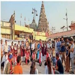
विष्णुपद परिसर में नुक्कड़ नाटक की प्रस्तुति करते स्वयंसेवक

अनुग्रह मेमोरियल कॉलेज में चल रहे आजादी का अमृत महोत्सव के आठवें दिन रागिनी को नुक्कड़ नाटक की प्रस्तुति के साथ ही स्वच्छता अभियान भी चलाया गया। युवा एवं खेल मंत्रालय भारत सरकार के निर्देशानुसार ऐतिहासिक स्थल पर स्वच्छता अभियान कार्यक्रम आयोजित का निर्देश था। जिसके अंतर्गत अंतरराष्ट्रीय स्थल के रूप में सुप्रसिद्ध विष्णुपद मंदिर परिसर में स्वच्छता अभियान चलाया गया। सर्वप्रथम प्रबंध विभाग की टोली ने स्वच्छता पर जागरूकता विषय आधारित नुक्कड़ नाटकों की